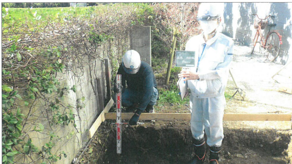
土間コンクリート増設工 掘削・床高測定