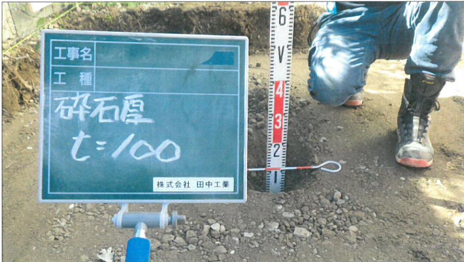
土間コンクリート増設工 基礎碎石厚測定