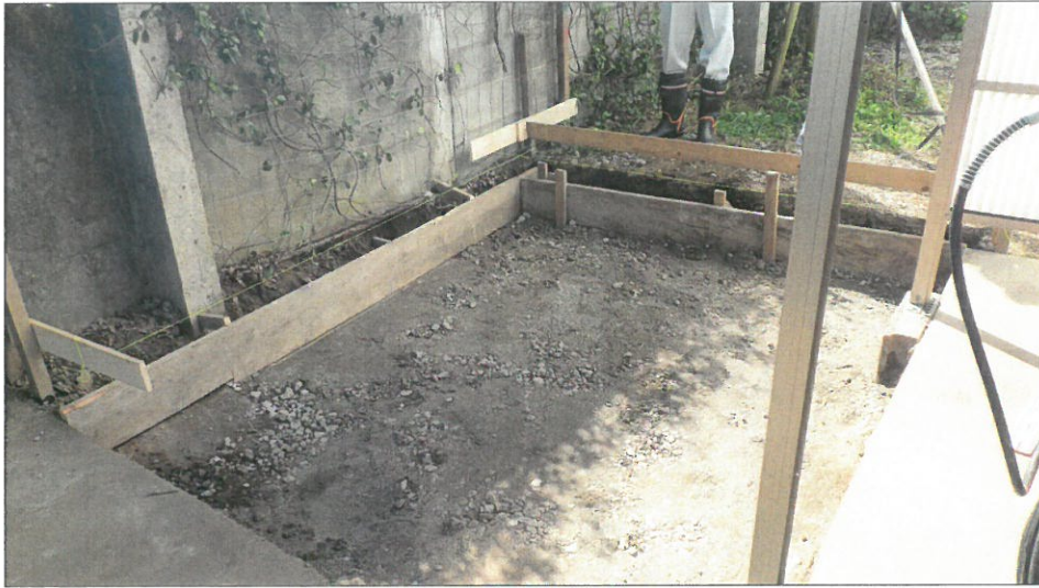
土間コンクリート増設工 型枠組立