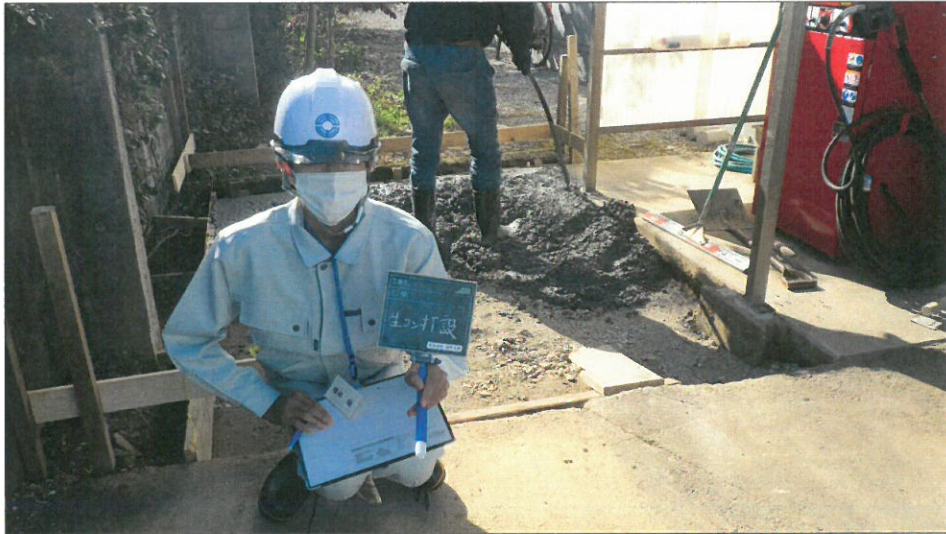
土間コンクリート増設工 コンクリート打設