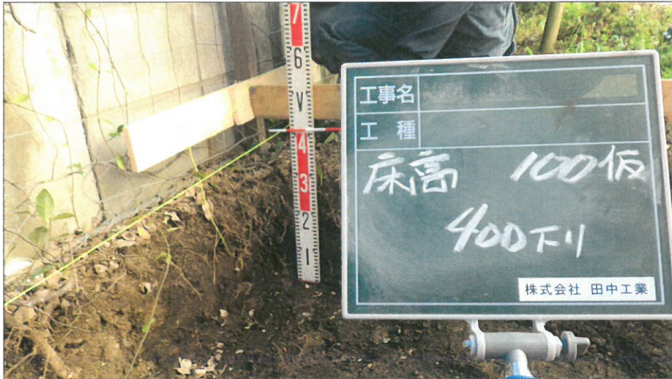
土間コンクリート増設工 掘削・床高測定