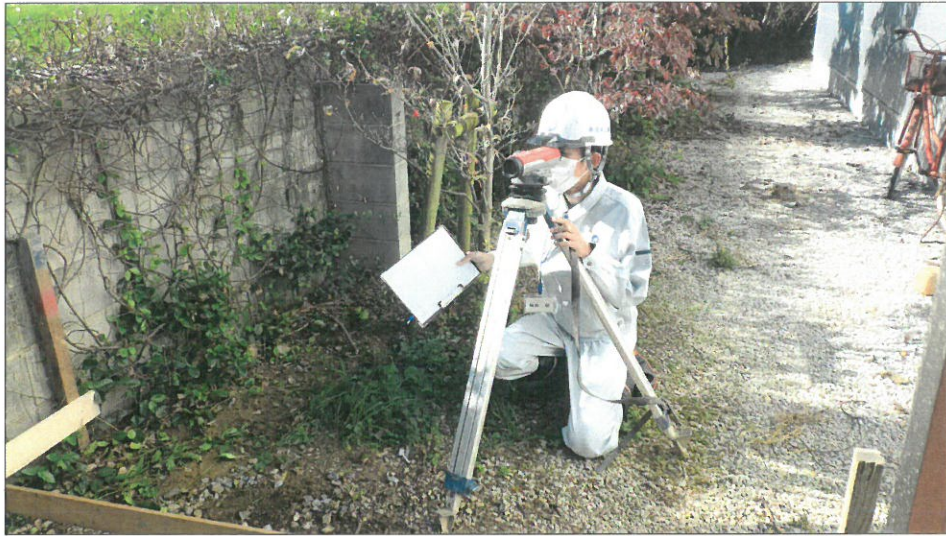
土間コンクリート増設工 丁張設置