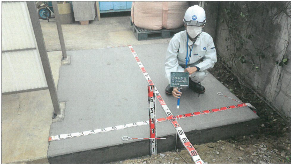
土間コンクリート増設工 出来形測定