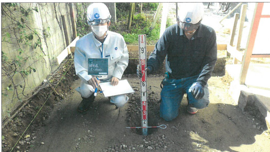
土間コンクリート増設工 基礎碎石厚測定