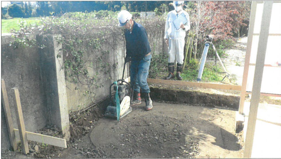
土間コンクリート増設工 基礎碎石締固め